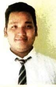
मुस्रि दानसोरां बसुमतारी (सोद्रोमा)