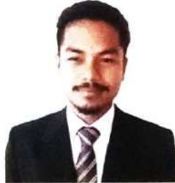
मुस्रि जॉसार अवारि (गाहाइ सुजुगिरि)