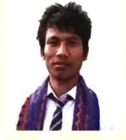
मुस्रि गोगं आफं बसुमतारी (सोद्रोमा)