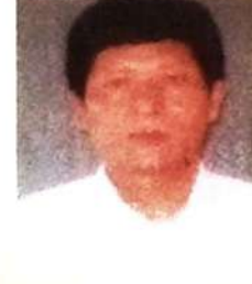
मुस्रि बारहुंखा मुसाहारी (थु. बोसोनगिरि)