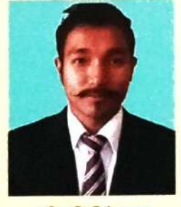
मुस्रि मिजिं ब्रह्म (सोद्रोमा)