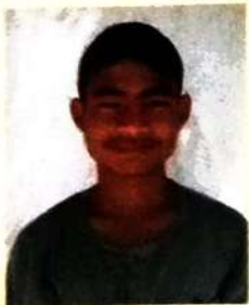
मुस्रि थुलुंगा बर' (सोद्रोमा)