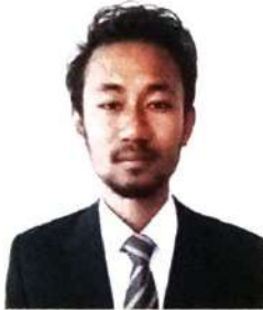
मुस्रि सोलेर नार्जारी (ले: नेहाथारी)