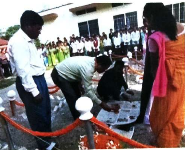
ईसान मोसाहार्शिनी जीसे बोसोगरि जोनोम बोसोर फालिनायाव बिबार बाउनाय ।