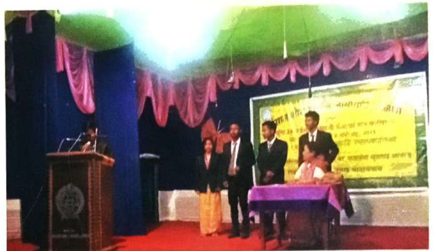
क 'क्राइमर सरकारी फरायसालिमानि बर' फरायसा धूनलाइ आफादनि मायफुं मोश्रमाफोर ।