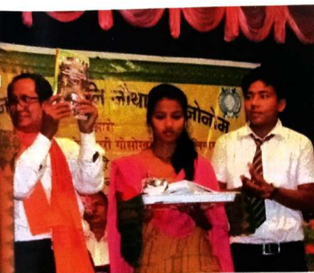
ईसान मोसाहार्शिनी जीसे बोसोगरि जोनोम बोसोर फालिनायाव 37थि बिसान 'अनजिमा' लाइमि बेछेबनाय ।