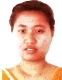
थरायना दिबियानिथा मुसाहारि थरायना निबिदिथा बसुमतारी (सोद्रोमा)