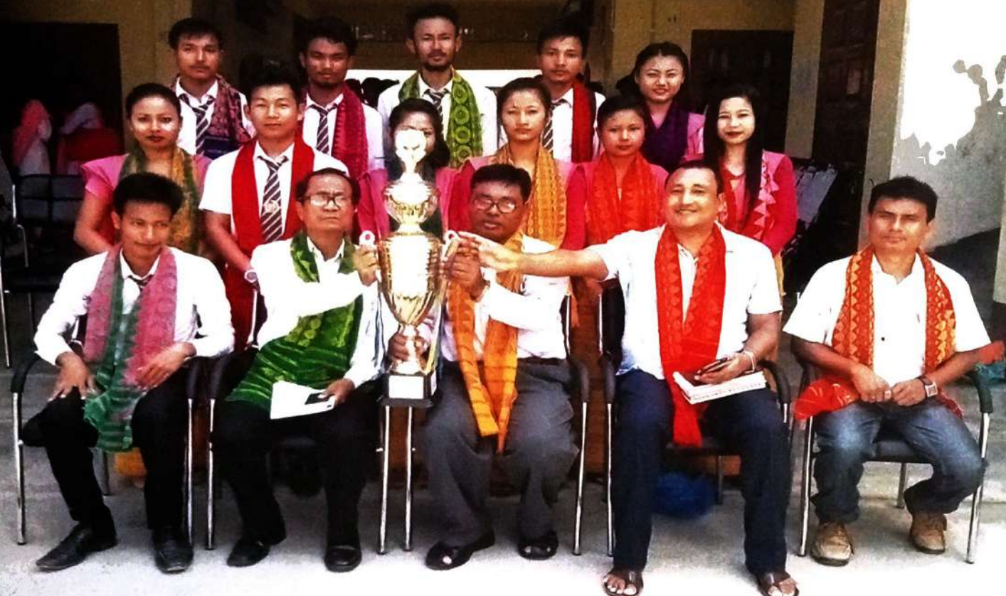
बिजनी फरायसालिमायाव खुंफुंजानाय सानजारां लक्षेश्वर ब्रह्मनि रुफाथि मायथाइ गोसोखां सान फालिनायाव साबसिन बादायारि फरायसालिमा बान्था मोन्नाय।