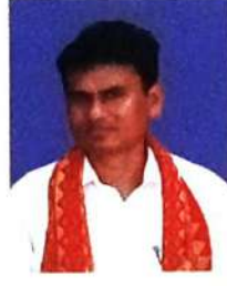
मुस्रि गनेश बर' (थु. बोसोनगिरि)