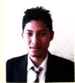
मुस्रि दैथुन इसवारि (सोद्रोमा)