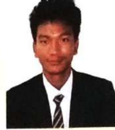
मुस्रि फुंजा मसाहारी (सुजुगिरि)