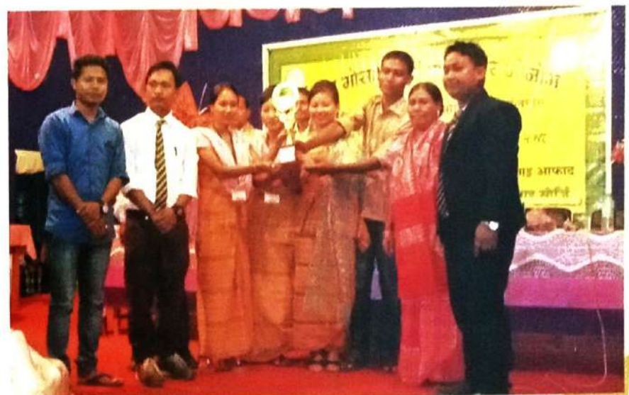
ईसान मोसाहार्शिनी जीसे बोसोगरि जोनोम बोसोर फालिनायाव राणी हेलेन अव्यारीआ ईसान उनरगिगि बांध्या गथायर्दा ।