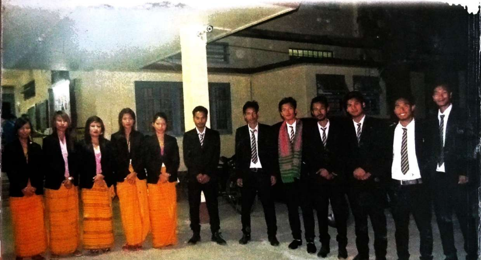
क 'क्राइर सरकारि फरायसालिमा बर' फरायसा थुनलाइ आफ्फाद आरो फरायसा आफ्फाद 2015-16